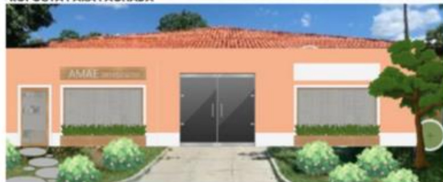
PROPOSTA PARA FACHADA

Projeto de Extensão: plano para melhorias na Loja da associação das Mulheres Artesãs e Empreendedoras (Amae), em Lajeado – TO.